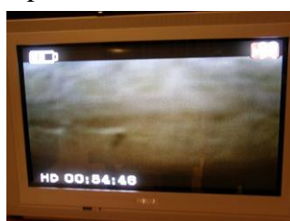
Détection de mouvement : enregistrement vidéo

Pressez brièvement le bouton mode pour passer en mode moniteur prise de photo en détection de mouvement (LED jaune et rouge allumée). Quand un objet mobile apparaît la camera prend une photo.