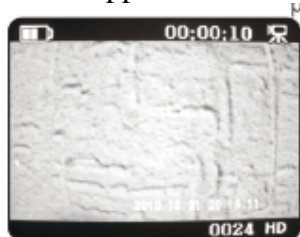
TV Video& Audio Playback_Video

Allumez la caméra. Après quelques secondes, les LED rouge et bleue s'allument et la dernière photo ou vidéo apparaît sur la TV.